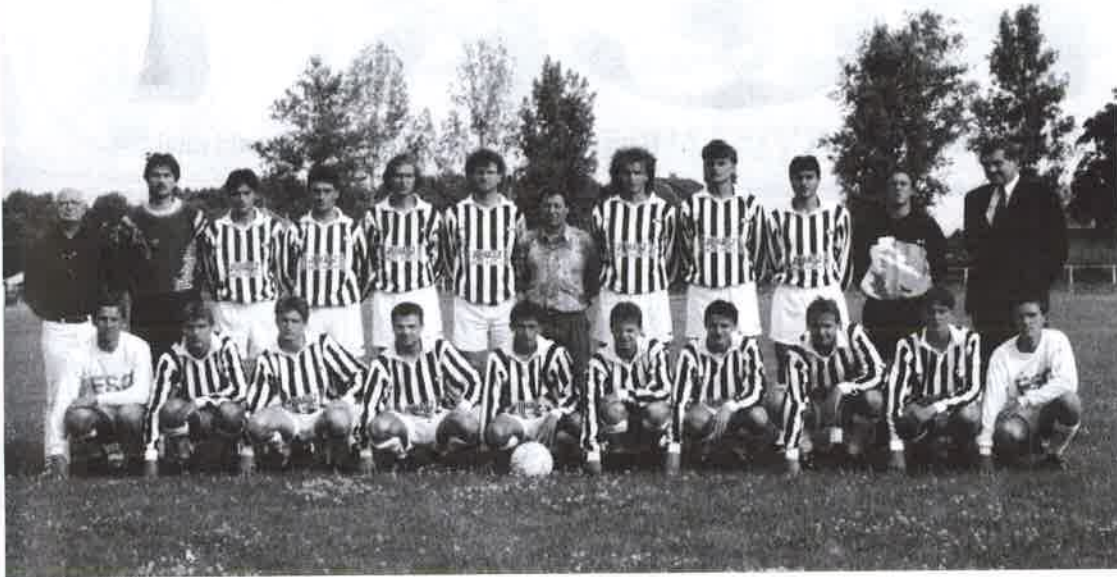
Ma, 1996-ban: FSC

Kezdetben még ezen a szinten dicsőség volt a falu csapatába bekerülni. Ám ma inkább már csak a pénz dominál a játékosoknál. Egy NB III-as bajnokságban játszó focista főleg, ha megfelelő számú szponzora van a csapatnak „túrhetően”, sőt talán még az átlagnál jobban is megél.