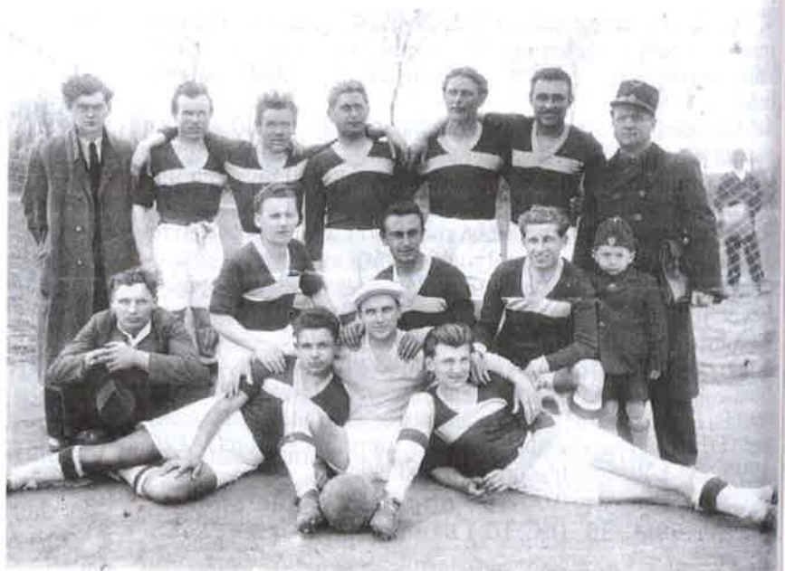
Negyvenes, ötvenes évek: FVSC

Sokat változott ez a sport az elmúlt, majd egy évszázad alatt, mivel külsőségében (felszerelés, szabályok stb.) mind pedig a játékosok mentalitásában.