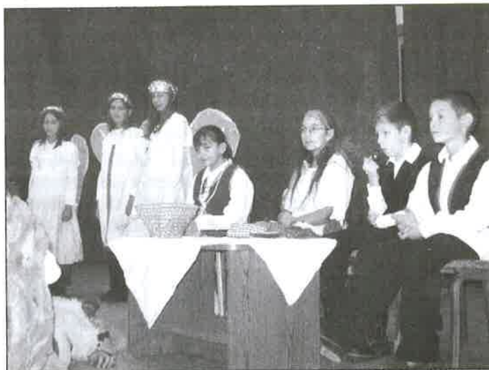
A széchenyis színjátszók egy korábbi fellépése

dent komolyan. A gyereknapi darabunk például a bolondozásról szólt. Azt is megmutattuk, hogy a gyereke néha rosszak és irigyek, de végül azért mindenkiben felülkerekedik a jó.