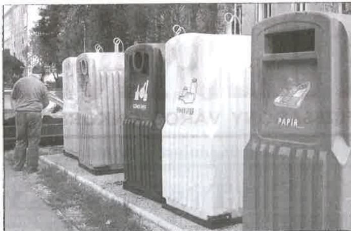
Szelektív hulladékgyűjtő konténersziget

amely jelentős mértékben csökkentheti a háztartási hulladék mennyiségét.