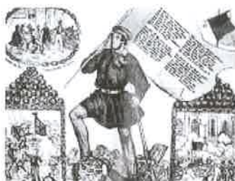
Berlin, március 18.

Ez kedvező körülményeket teremtett ahhoz, hogy a magyarországi reformelképzelések törvényes úton megvalósuljanak. Kossuth a parlament küldöttségével 1848. március 15-én Bécsbe utazott , hogy az országgyűlés által megszavazott követeléseket elfogadtassák az uralkodóval.