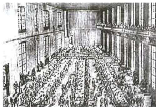
Az alsóház ülésterme Pozsonyban

Az 1830-as évektől a magyar reformtörekvések legfontosabb színtere a pozsonyi országgyűlés volt, amely még a rendi társadalom szabályai szerint működött. A modernizációs törekvéseket megjelenítő javaslatok a megyei követekből álló alsóházban születtek, amit a felsőháznak is támogatnia kellett, hogy az uralkodó elé kerülhessenek, s csak uralkodói szentesítéssel váltak törvénné.