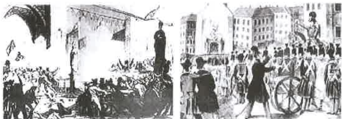
Palermo, január 12.

1848 első hónapjaiban Európa számos nagyvárosában forradalmak törtek ki.