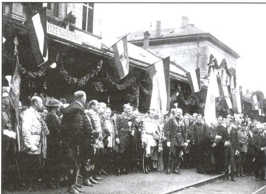
A Szent Jobbot váró vármegyei küldöttség

Mivel a szervezéssel kapcsolatos feladatok meghaladják a testület képességeit,