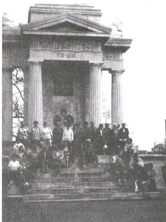
Az ó-pusztaszeri Nemzeti Parkban

A környezet szépsége, s a barlangtúra látványai maradandó élménnyel