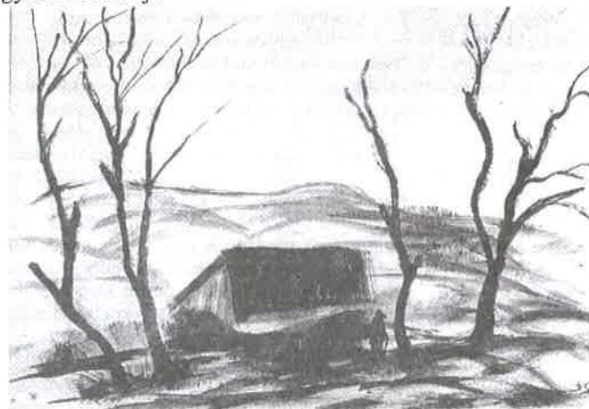
Dilinkó Gábor grafikája