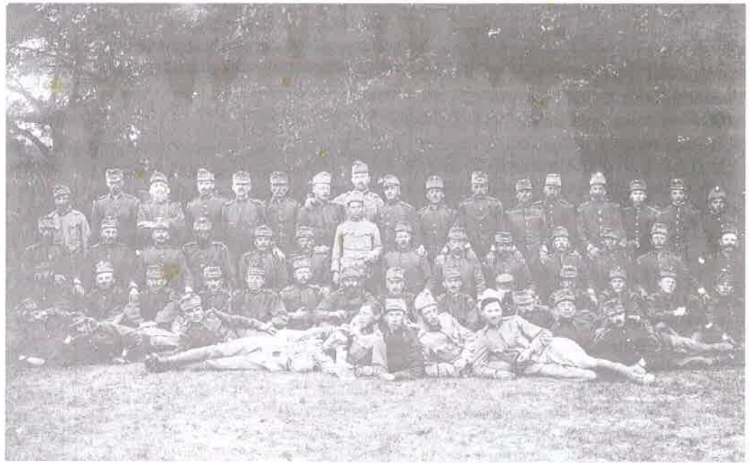
Frontra induló népfelkelők 1914-ben