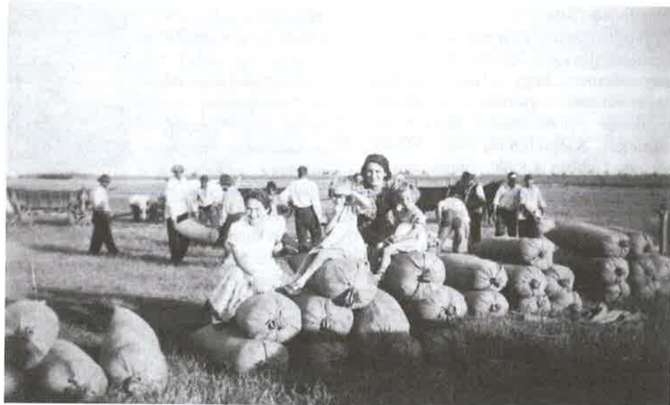
A kicsévelt búza zsákokba került – 1940

Sarlós Boldogasszony - július 2.: Aszszonyoknak dologtíltó nap, más helyeken