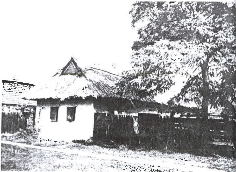
Árpád út 15.

Az épület többször lett átalakítva és bővítve, de az